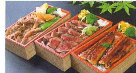
特選すき焼き重 松阪牛ステーキ重 うなぎ重

一の重/松阪牛ステーキ、季節の焼魚、揚物、和え物、 酢物、デザート 二の重/彩りちらし寿司、季節御飯、旬の炊合せ