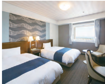
ベビュールーム ツインスタンダード