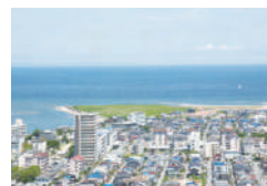
▲海側客室からの景色