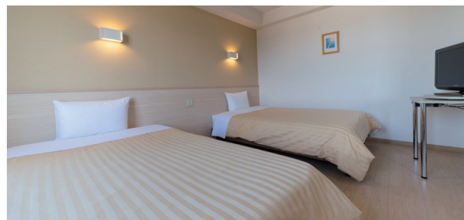
ツインスタンダード